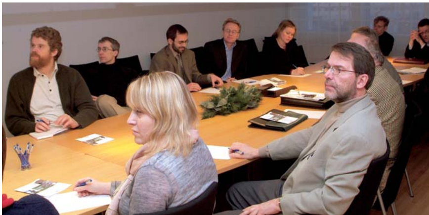
30. nóvember var haldinn fundur með þeim sem fengu réttindi sem „epo umboðsmenn“.

Í desember sótti forstjóri fund í Prag, á vegum Evrópsku einkaleyfa akademíunnar varðandi fyrirkomulag og þörf á fræðslu og þjálfun evrópskra umboðsmanna í nýjum aðildarríkjum. Fundinn sóttu einnig fulltrúi FUVÉ, Félags umboðsmanna um vörumerki og einkaleyfi og fulltrúi Íslands í EPI, samtökum evrópskra umboðsmanna.